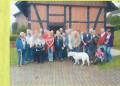
Der Schnatgang Die Fahrten